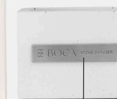
СТИКЕР / ШИЛЬД НА КАШПО