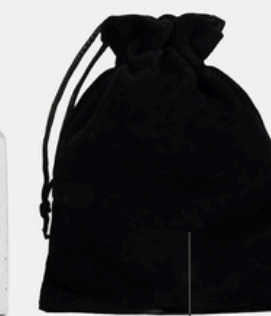
ПЕЧАТЬ НА МЕШОЧЕК