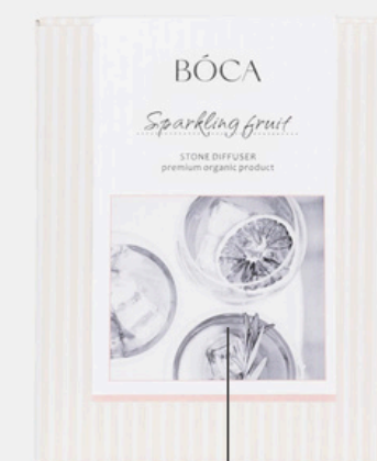
СТИКЕР НА КОРОБКУ